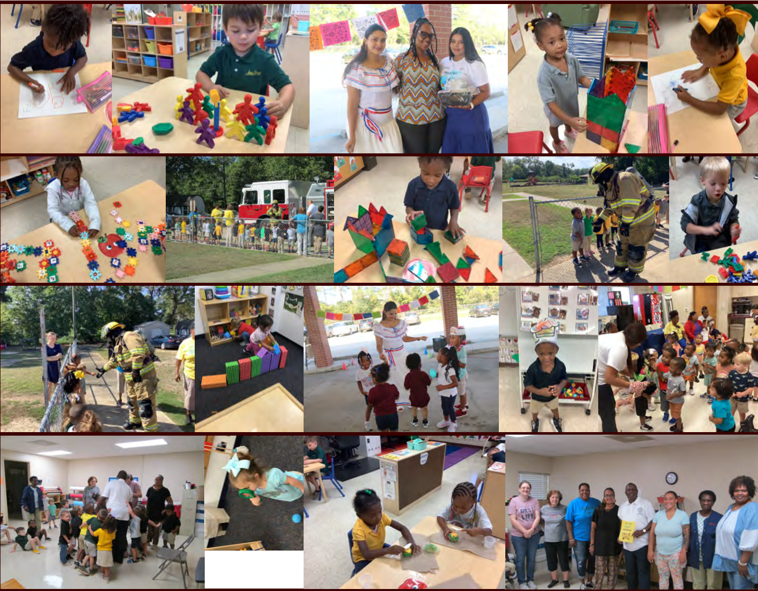
EHS ROSA & ANNIE'S CCP: DIA DE LOS ABUELOS!